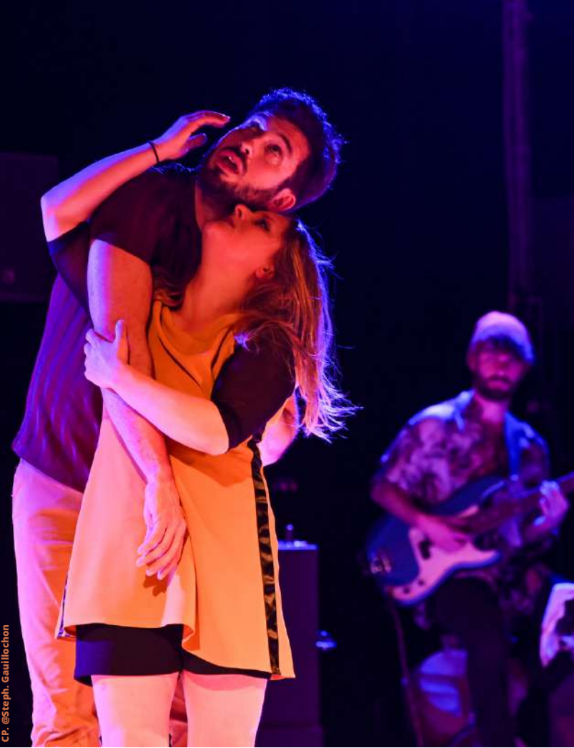
CP. @Steph. Gaullochon